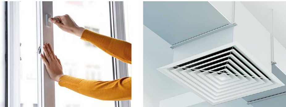
Abb. 1 Lüften über Fenster (links) oder mit Raumluftechnischer Anlage (rechts)

Insofern leistet intensives, sachgerechtes Lüften einen wichtigen Beitrag zum Infektionsschutz. Ziel entsprechender Maßnahmen ist dabei vorrangig eine ausreichende Versorgung des Raumes mit Außenluft, um die Anreicherung möglicherweise virenbelasteter feinsten Tröpfchen – sog. Aerosole – in der Raumluft zu verringern und damit das Ansteckungsrisiko zu senken. Als sogenanntes infektionsschutzgerechtes Lüften basiert es auf den Empfehlungen der Technischen Regel für Arbeitsstätten ASR A3.6 „Lüftung“ sowie der SARS-CoV-2-Arbeitsschutzregel. Die Außenluftzufuhr erfolgt entweder über freie Lüftung (zumeist Fensterlüftung) oder eine maschinelle Lüftung mit Ventilatoren (Raumluftechnische Anlagen – RLT-Anlagen), Abbildung 1. Eine gute Lüftung führt Kohlendioxid ( \text{CO}_2 ), Wasserdampf (Luftfeuchte), Luftschadstoffe und ggf. auch Viren aus der Raumluft rasch, effizient und kostengünstig nach außen ab.